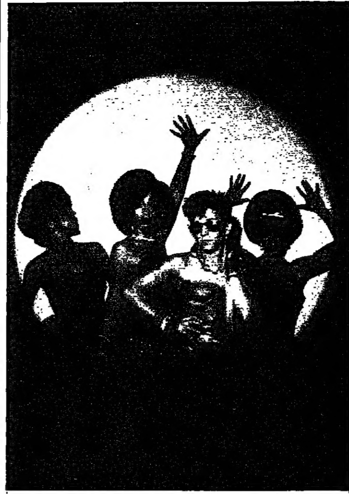
فريق لجنيد: الروك جزء من الثورة على التكنولوجيا... انها عودة الى سرعة الروك... وبعضهم يقول انها العودة الصارخة...